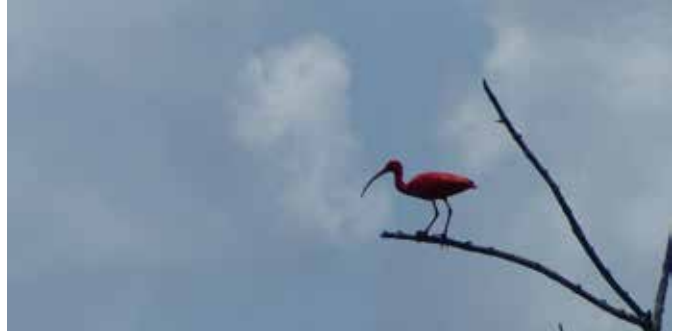
De rode ibis

In het gebied zijn reeds 122 soorten vogels geteld, waarvan 72 het gehele jaar in het gebied voorkomen, waaronder de rode ibis.