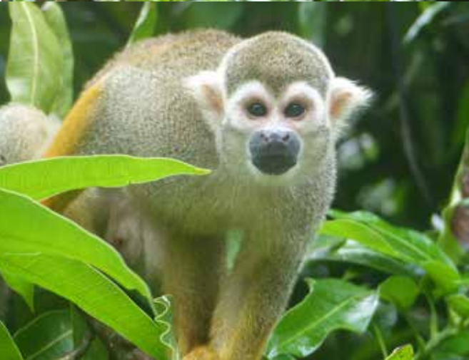
Apen in de tuin