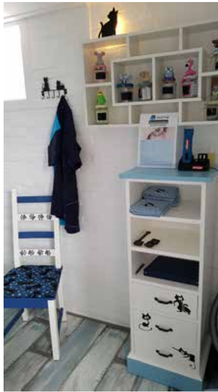
Stoel voor het baasje