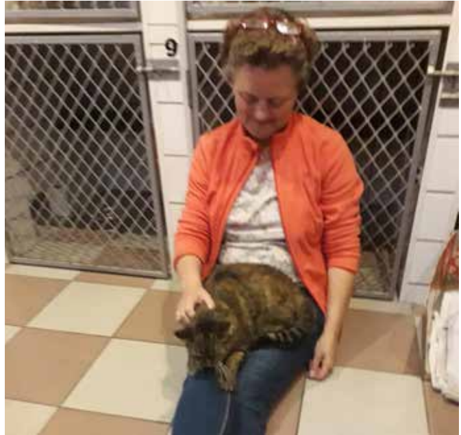
Ook op 19 november: 'Jaaa, ik durf het!'