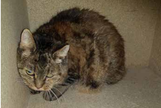
Myra op 4 november, haar eerste dag bij ons.

Wij zijn nu een week verder en Myra laat zich graag aanhalen. Zoals op de foto van 4 november te zien is, ziet ze er op dit moment nogal schuchter uit, maar nu zijn wij een week verder en is Myra al een stuk rustiger.