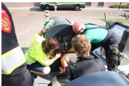
Greep uit de vuilcontainer.

Aangezien dat onze website verouderd is, is er een start gemaakt met de bouw van een nieuwe website, deze zal in 2023 de lucht in gaan.